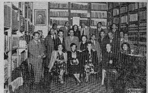
Grupo de Intelectuales Centroamericanos que firmaron dicho cablegrama.

La idea fue inmediatamente aceptada por cuantos integran la Asociación, y así fue esa no solamente la primer acción trascendente de la recién fundada institución cultural, sino que fue también Guatemala el primer país centroamericano que dió el primer paso. Entre los firmantes se encuentran los siguientes intelectuales y