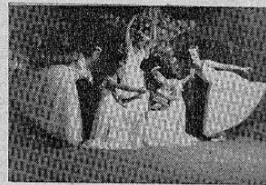
Grupo de distinguidas alumnas en una brillante presentación del Ballet

Rendimos un aplauso cordial a los profesores Katchourovsky y Tchernova por la grandiosa obra cultural artística que están realizando, mediante una devoción profunda por el arte, y esperamos que en fecha no lejana coronen su grandiosa obra con el éxito que su esfuerzo y su talento merecen.