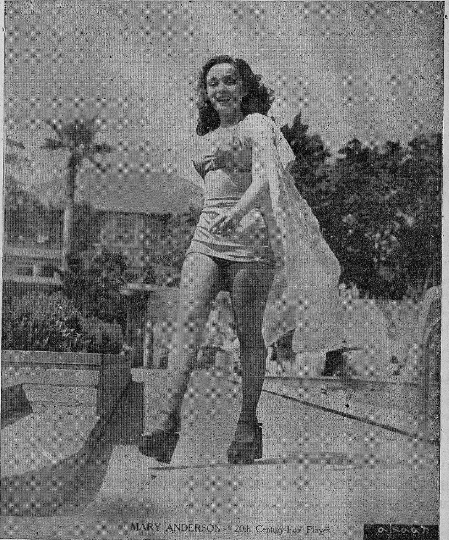
MARY ANDERSON - 20th Century-Fox Player

Joven estrellita de la 20th Century Fox que nos muestra el encanto de los trajes de baño que muy pronto empezarán a verse para los espectadores. Decididamente que con aires de esta naturaleza y con una piscina a la par, cualquier verano, por más caluroso tiene que ser grato.