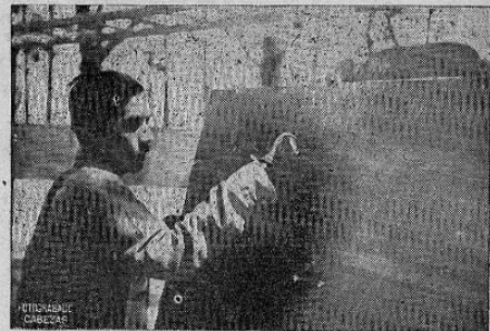
Otro de los alumnos enfermos de la Sección de Enseñanza escribiendo en el pizarrón valiéndose también de su mano artificial.